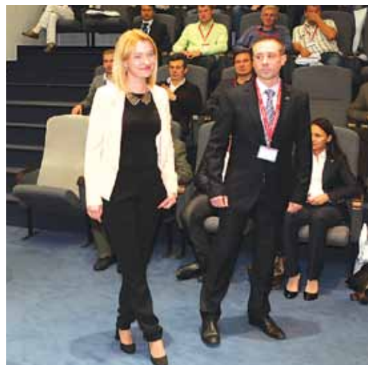
Представители компании Verna получают награду в номинации «Лучший проект аутсорсинга в ИТ-сфере»

туда, где имеются ресурсы, есть платежеспособный клиент и приемлемые условия для ведения бизнеса. Подтверждением его слов можно считать рост активности украинских компаний за пределами родины. Все больше проектов начинают реализовываться силами отечественных специалистов на территории Молдовы, Казахстана, Азербайджана, Белоруссии.