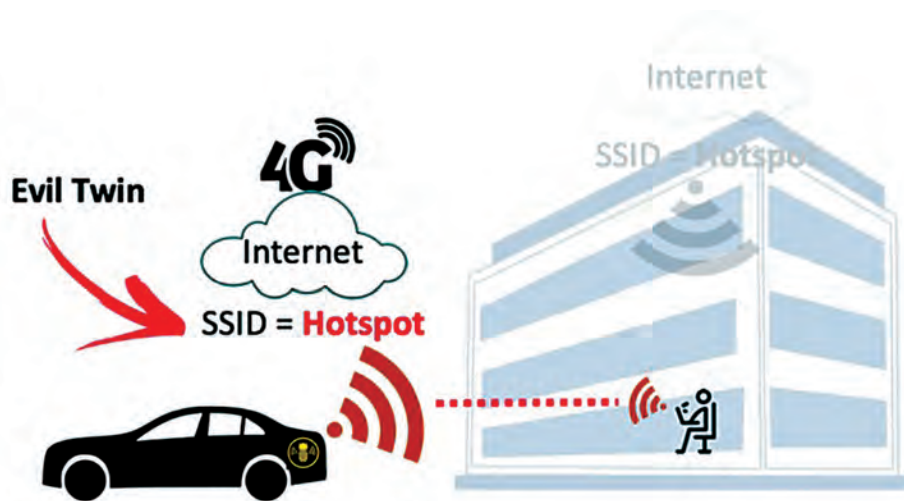
Рис. 2. Атака хакеров GPU с помощью Evil Twin (схема WatchGuard)

загруженная открытая сеть, жертвы подключаются к поддельной AP в течение нескольких секунд. Если же убедить пользовательское устройство перейти на фиктивную AP не удастся, злоумышленники могут прибегнуть к деаутентификационной атаке, посылая поток поддельных сообщений о прерывании соединения.