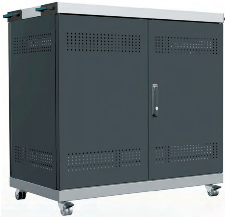
Рис. 5. Шафа для ноутбуків Conteg EDURACK-3