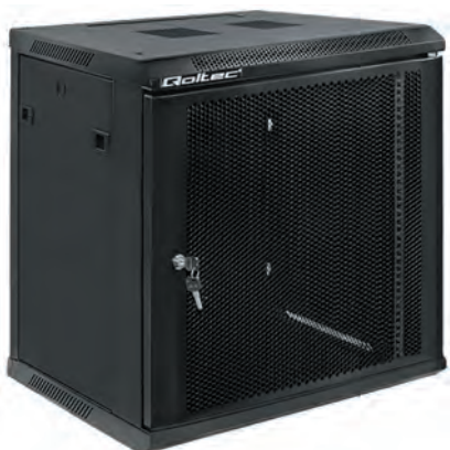
Рис. 6. Одна з моделей настінних шаф Qoltec: 12U з перфорованими дверима

Власне лінійка настінних шаф має у своєму складі моделі від 4U до 12U, габарити від 280×450 мм до 635×600 мм (рис. 6). Шафи пропонуються в двох кольорах, мають перфоровані або скляні двері з замком, знімні бічні панелі, є можливість встановлення вентиляторів.