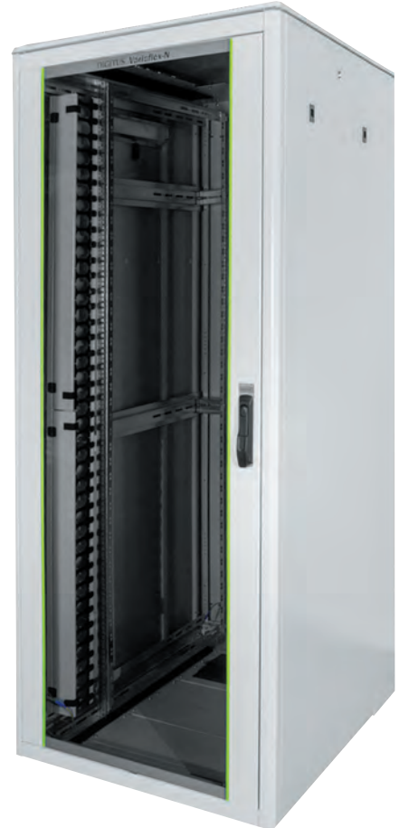
Рис. 8. Шафа для мережевого обладнання Digitus Varioflex-N

обладнання Varioflex-N (рис. 8). Вона має розмір 42U, підлога модульна зі знімними панелями, передні двері являють собою металевий каркас зі скляною панеллю. Задні сталеві двері є розкладними, бічні секції також можна знімати.