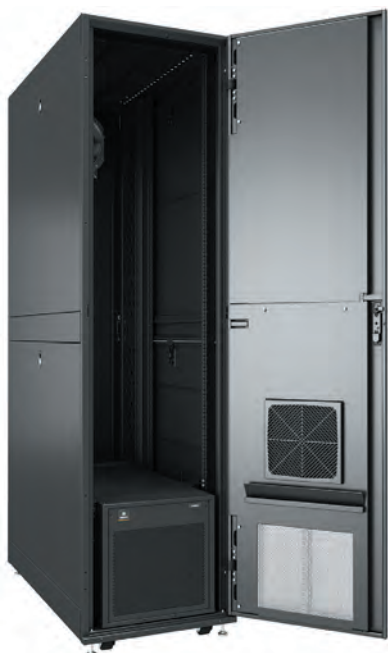
Рис. 3. Інтегрований мікро-ЦОД Vertiv VRC-S

Що стосується новинок, то з'явилося рішення VRC-S integrated micro data center ( рис. 3 ) — це «мікроЦОД у шафі», який має у своєму складі обладнання безперебійного живлення, кондиціонування і моніторингу. Докладніше про нього — в іншій статті, присвяченій інженерній інфраструктурі ЦОД.