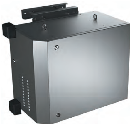
Рис. 10. Навісна всепогодна та антивандальна шафа ТЕСО AW-W 3U-7U

Так само очевидно, що перспективи ринку безпосередньо залежать від ходу війни. Тим часом виробники та імпортери бачать своє завдання в тому, щоб допомагати фронту і країні у відновленні економіки, зберігати контакти у своїй екосистемі (виробники, перевізники, інсталювальники та замовники), і, зрештою, постачати на ринок якісну продукцію.