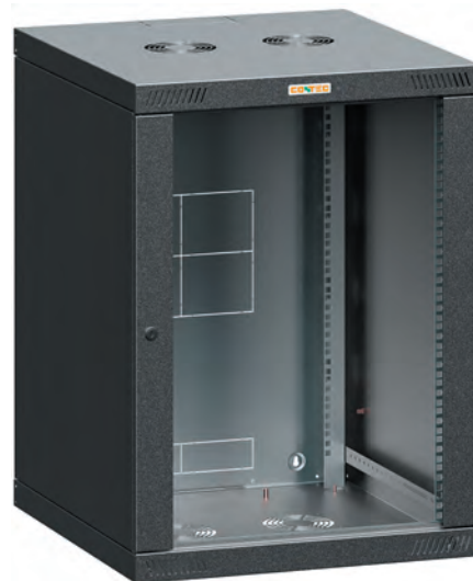
Рис. 4. Бюджетна настінна шафа Conteg iSEVEN RQN у чорному виконанні

Для безпеки передні двері подвійні з трьома замками.