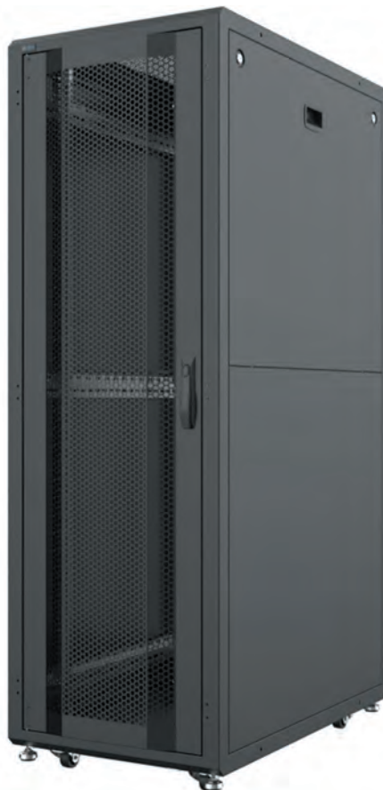
Рис. 7. Шафа Mersan DC Server

У цього турецького виробника з'явилися шафи для ЦОД під маркою DC Server (рис. 7), які розраховані на статичне навантаження 3000 кг. Це вільнопоставлені шафи, з яких можна сформувати коридор, розмістивши їх стінка до стінки. Як видно з назви, шафи розраховані на розміщення серверів. Лінійка налічує 8 моделей розміром від 33U до 48U. Доступні вони у білому або чорному кольорі, передні двері можуть бути скляні або перфоровані.