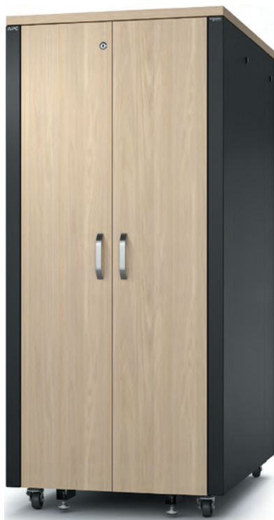
Рис. 2. Шафа APC NetShelter 32U

Київ, вул. Івана Дяченка, 20-А www.cms.ua +380 (97) 576-22-88