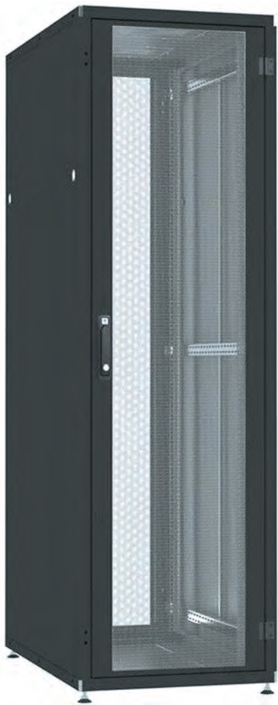
Рис. 9. Розбірна шафа ZPAS IT-456012-45AA-5-161-FP

Що стосується новинок минулого року, то нам назвали модель IT-456012-45AA-5-161-FP (рис. 9). Це універсальна підлогова розбірна шафа висотою 45U, розміри — 600×1200 мм. Шафа має перфоровані передні двері і розпашні задні, максимальний кут відкриття дверей — 180°. Можливий вибір лівостороннього або правостороннього навішування дверей. Також шафи підходять для з'єднання рядами у системі Data Box.