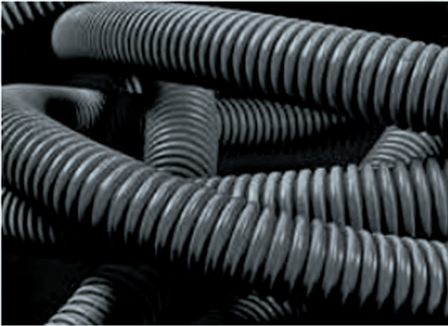
Рис. 1. УФ-стійкі труби серії Ostorpus (з каталогу «ДКС України»)

області випускаються гофровані труби одностінні, гнучкі і жорсткі двостінні, гнучкі армовані і жорсткі гладкостінні, а також пластикові коробки (мініканали від 22×10 до 40×40 мм).