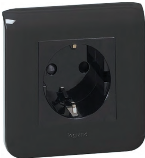
Рис. 3. Чорна розетка Legrand Mosaic

Іншою новинкою минулого року стала раніше анонсована серія кабельних каналів чорного кольору. Вони мають дизайнерські переваги: з одного боку, уможливають малопомітне розміщення на темному тлі, наприклад, у театрах чи кінотеатрах, а з іншого — навпаки, дозволяють