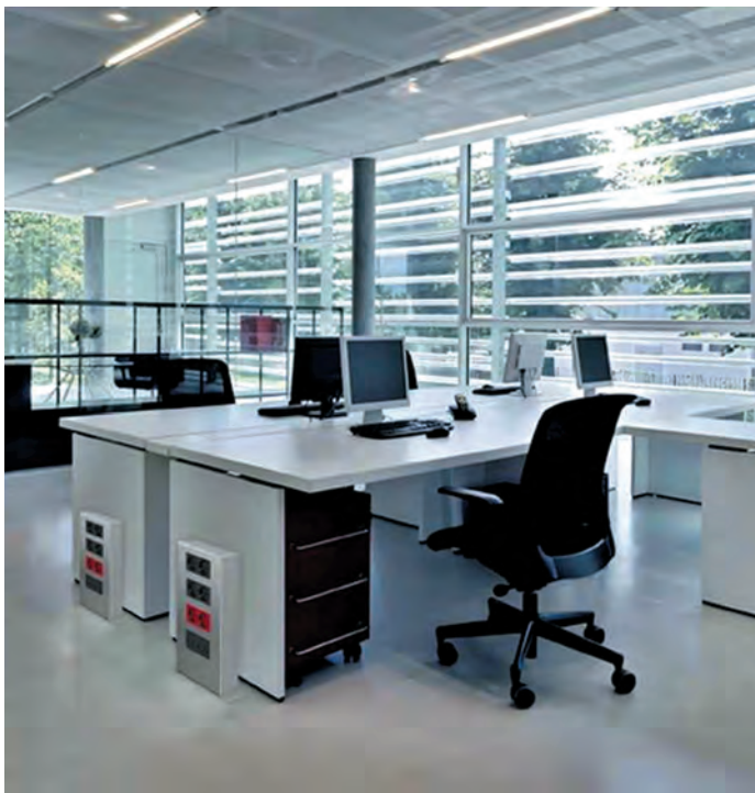
Рис. 2. Башточки серії Simon 500

Підлогові рішення Simon включають три серії люків (підлогових коробок). Найбільш популярні — серії SF з горизонтальним розміщенням електроінсталяції і маленькі лючки KSE з рівнем захисту IP66 для встановлення в суху або заливну підлогу з можливістю їх з'єднання між собою. Башточки ST призначені для встановлення модулів Simon 500 CIMA, а KT — приладів 45×45, саме вони користуються найбільшим попитом. Також асортимент включає колони і мініколони серій ALC і ALK, перші призначені для монтажу власних приладів Simon або приладів 45×45 через адаптери, але споживач надає перевагу другим, де безпосередньо встановлюється обладнання 45×45.