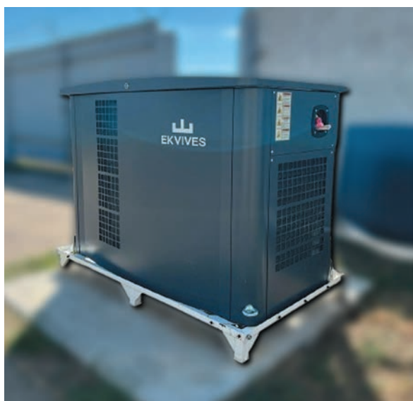
Рис. 5. Одна з установок Ekvives, змонтованих на об'єктах оператора енергетичної інфраструктури

змонтовано на об'єктах «одного з ключових операторів енергетичної інфраструктури» (рис. 5). Компанія «Еквівес» виконала увесь комплекс робіт, від виробництва та передпускової підготовки до введення в роботу і навчання персоналу замовника. Особливостями проекту були стислі строки виконання (замовник вимагав введення установок в роботу до початку пікового енергетичного сезону), необхідність синхронної доставки обладнання в регіони України з різною доступністю і робота на об'єктах, більшість з яких мали обмежений доступ на територію.