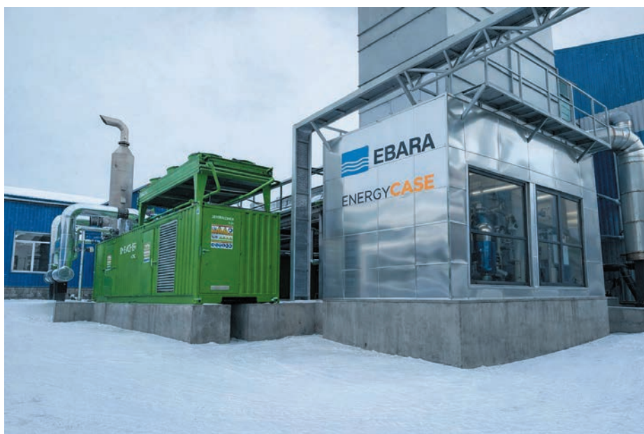
Рис. 1. ГПЕ Jenbacher з холодильною машиною EBARA

Про свої проекти KTS Engineering розповідає в соцмережах. Рік тому на одному з українських молокозаводів було встановлено промислову холодильну машину японської марки EBARA, яка виробляє холод з теплових відходів когенераційної установки (рис. 1). Це дозволило досягти економії газу у 40% (з класичними електричними чилерами виробництво споживало б 1,4 МВт, а з використанням теплових відходів достатньо 850 кВт