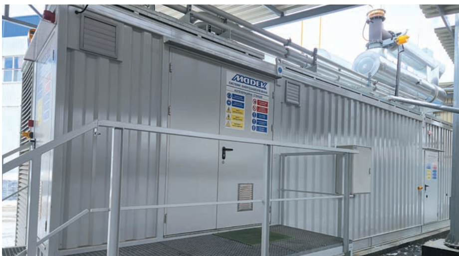
Рис. 3. Контейнерна електростанція MTU в Київській області

Газопоршневі установки MTU розраховані на постійну довготривалу роботу як для забезпечення життєдіяльності підприємств, так і для роботи на енергоринку. Установки мають високий електричний ККД і низьку вартість володіння. Найбільш значущі проекти на цьому обладнанні у світі пов'язані з стратегічними енергетичними системами, де застосовуються установки з потужними газовими/водневими двигунами. Наприклад, Rolls-Royce поставила 36 газових генераторів MTU, кожен з яких має базову потужність