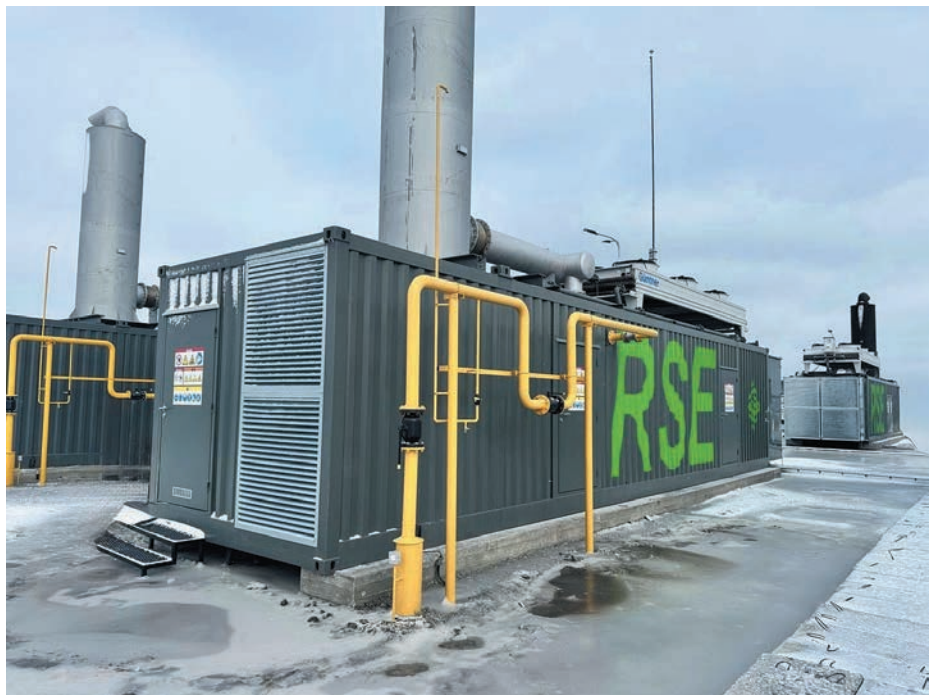
Рис. 2. ГПЕ RSE як елемент розподіленої генерації. Ландшафт заблюрено з міркувань безпеки

Електростанції RSE мають потужність від 400 кВт до 4,5 МВт. Вони постачаються у зібраному вигляді і готові до швидкого розгортання. В базову комплектацію, окрім двигуна і генератора, входять модулі подачі й очищення палива, системи охолодження, змащення та вентиляції, шафи керування, захисту й синхронізації. Додатково виробник пропонує індивідуальні тепlopункти, блокові трансформаторні підстанції, обладнання для підготовки газу і котли-утилізатори тепла.