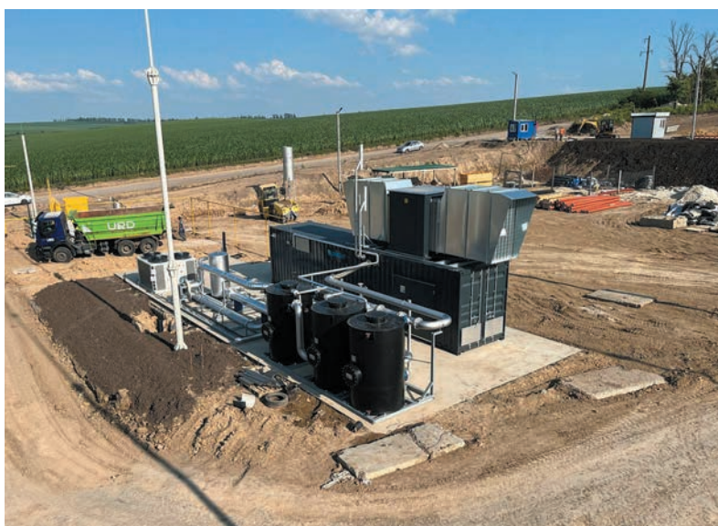
Рис. 6. ГПЕ 2G Agenitor 408 BG змонтовано на біометановому заводі у Хмельницькій обл.

Виробник заявляє, що установки виходять на повну потужність протягом 90–300 секунд.