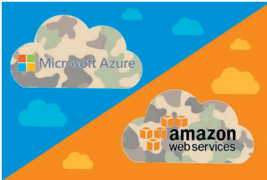
В финал конкурса вышли Microsoft и Amazon

был подан иск о якобы наличии конфликта интересов (мол, один из сотрудников Минобороны, имеющий отношение к выработке требований контракта, ранее работал в Amazon). Подтверждений влияния так и не было найдено. Были и другие подобные претензии от Oracle и IBM. В результате объявление победителя, которое было запланировано на апрель, состоялось только в конце октября 2019-го. Но против Microsoft никто обвинений не выдвигал — все были настолько уверены в победе Amazon, что еще в начале ноября Oracle подавал апелляции в суд, направленные против этой компании (которые были отклонены). Так что победа Microsoft выглядит весьма неожиданной. Но это лишь на первый взгляд.