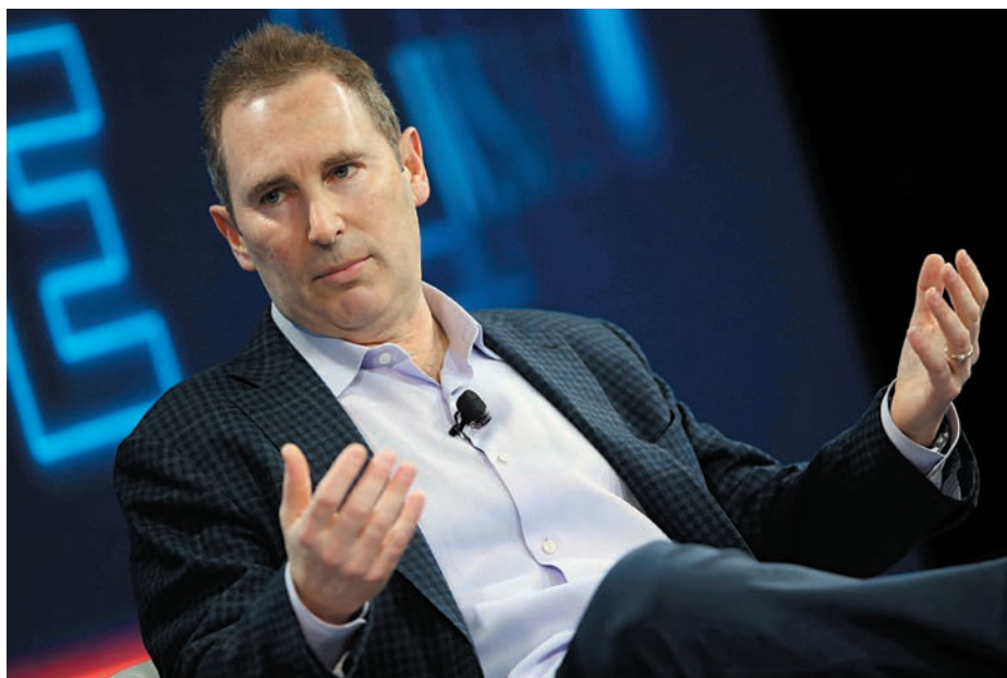
Энди Джасси — руководитель Amazon Web Services, усомнился в справедливости решения Пентагона по JEDI

В завершение отметим, что глядя на противостояние американских (и мировых) облачных гигантов, легко предположить, какая борьба развернется в Украине в том случае, если государственные структуры начнут массово переходить в облако. У нас тоже всего несколько крупных операторов, которые отвечают требованиям по защищенности облака и дата-центра для государственных структур (в частности, имеют аттестат соответствия КСЗИ). Правда, суммы тендеров, скорее всего, будут на три порядка меньше, чем в США, но битва за крупного госзаказчика от этого вряд ли окажется менее ожесточенной.